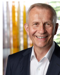
Werner Geiger Agamus Consult