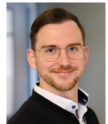
Pascal Nagel Automobil Produktion