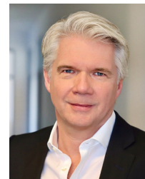
Dirk Reusch Automobil Produktion