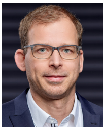
Fabian Troll Porsche Leipzig GmbH