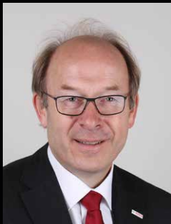
Johannes Lauterbach Robert Bosch GmbH