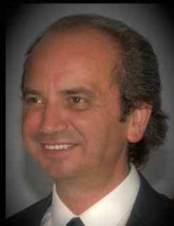
Alfredo Leggero Fiat Chrysler Automobiles